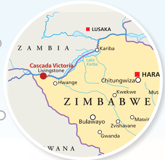
▲ Localizarea pe hartă a cascadei Victoria

Această minune a naturii este rezultatul umplerii cu gresie moale a crăpăturilor din roca dură de bazalt a podișului. Înainte ca Zambeziul Superior să străbată acest platou, a găsit aceste crăpături și a început să macine rocile moi, creând o serie de chei . Eroziunea acestor fisuri umplute cu rocă moale s-a petrecut de-a lungul a milioane de ani. Acestea formează prăpastia în zigzag numită Cheile Batoka. De-a lungul mileniilor, zona a fost lovită constant de curenții puternicului fluviu Zambezi. Această acțiune a sculptat faliile și fisurile, rezultând nu una, ci opt prăpastii succesive.