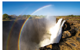
▲ Curcubeu în cascada Victoria

La apus, cascada Victoria oferă o frumoasă și rară priveliște. Un curcubeu se formează din reflexia luminii lunii în apă, cunoscută și ca „arcuLunii”. Spectacolul durează de la apus până la răsărit și este una dintre cele mai distinctive și mai izbitoare priveliști de pe continentul african.