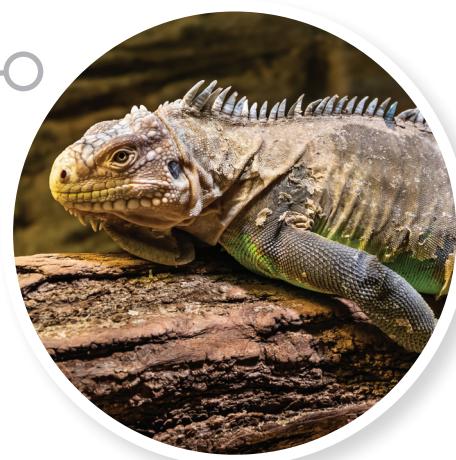
▲ Iguanele sunt șopârle mari, cu o lungime de aproximativ 1,8 metri și care cântăresc în jur de 11 kilograme.

Există în jur de 450 de soiuri de păsări; tucanul, coțofana, papagalul sau nagățul sunt întâlnite în această regiune. Aici există specii diferite de pești, printre care somonul auriu și pisica-de-mare.