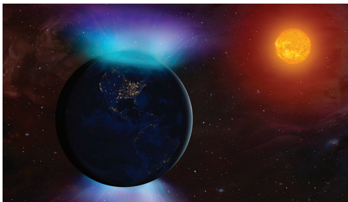
◀ Câmpul magnetic al Pământului cu vânt solar

Aurorele se formează atunci când particulele încărcate electric de la Soare, în timpul unei erupții solare, penetrează câmpul magnetic și intră în coliziune cu atomii și moleculele din atmosfera terestră. Această coliziune produce nenumărate explozii de lumină numite fotoni, care alcătuiesc aurora. Variațiile de culoare sunt posibile datorită tipurilor de particule care intră în coliziune. Atmosfera terestră este alcătuită, predominant, din oxigen și nitrogen. Când particulele solare urcă în atmosfera terestră, acestea se ciocnesc cu atomii celor două elemente. În acest moment, acestea elimină electronii și lasă în urmă ionii . În schimb, ionii elimină radiații la variate lungimi de undă și formează diverse culori. Coliziunile dintre particulele solare și oxigen creează lumina roșie sau verde și, în același fel, coliziunea cu nitrogenul formează verdele și violetul.