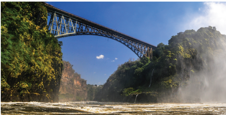
▲ Podul peste fluviul Zambezi este situat chiar mai jos de căderea de apă. Este o legătură între două țări, iar la ambele capete sunt posturi de frontieră.

Cascada acoperă întreaga lățime a fluviului Zambezi. Aproximativ 550 de milioane de litri de apă cad de la 108 metri înălțime într-un minut. Apa continuă apoi să curgă în aval, ca Zambezi Inferior. În perioada sezonului umed se întinde pe o lățime de 1,3 kilometri, iar debitul mediu este în jur de 935 m 3 /s. Ceața generată de apă în cădere este deosebit de densă în sezonul ploios.