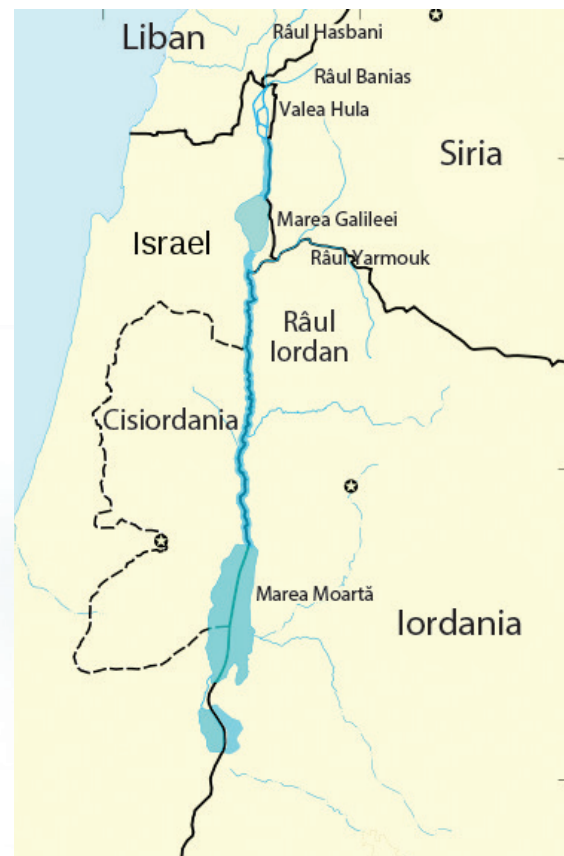
▲ Localizarea pe hartă a Mării Moarte

Din cauza înaltului conținut de sare din Marea Moartă, peștii și alte animale acvatice, precum și plantele nu pot trăi aici. Cu toate acestea, ecosistemul este plin de viață. Sunt păsări migratoare care pot fi văzute pe cerul Mării Moarte. Animale ca liliacul, pisica sălbatică, ibexul, cămila, iepurele de câmp, șacalul și chiar leopardul sunt întâlnite în munții din preajmă. Delta râului Iordan formează o junglă de papirusi și palmieri. Este interesant de știut că, în secolul I d.H., istoricul Titus Flavius descria Ierihonul, la nord de Marea Moartă, ca fiind „cel mai fertil loc din Iudeea”. Culturi agricole valoroase precum cea de trestie-de-zahăr, hena și seva arboreului balsamic – care era folosită la fabricarea parfumurilor – se găseau odată aici. În vremurile moderne, cea mai importantă cultură din zonă este cea de curmale.